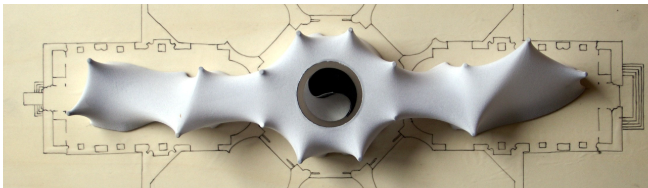
Occupation de l'espace d'exposition (environ 700 m 2 ) avec 50 Kg de matière !

J'attends donc beaucoup de la discussion avec chaque exposant et de l'échange des points de vue pour booster la mise en situation de chaque pièce.